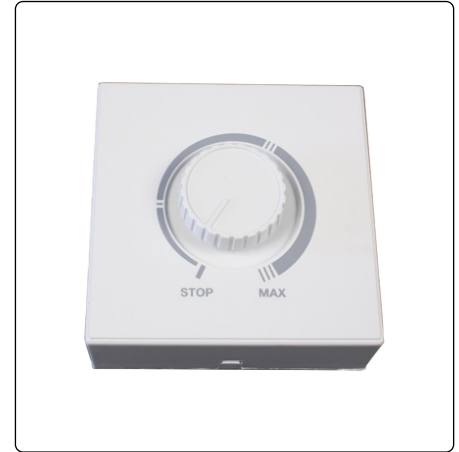
● Regulador de velocidad manual RMM