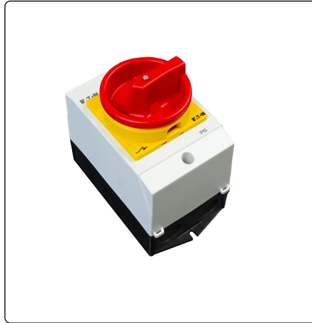
● Interruptor ON/OFF