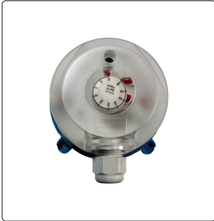
● Presostato diferencial